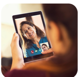
edukačné videá na rôzne témy