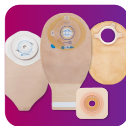
odborné poradenstvo o produktoch a bezplatné vzorky