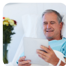
využitie tabletov v nemocniciach na edukáciu