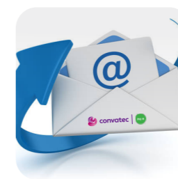
pravidelné zasielanie emailov

Naše pravidelne zasielané emaily vám dajú veľa tipov a rád týkajúcich sa životného štýlu, budete vedieť o novinkách v starostlivosti o stómiu a o produktoch. Môžete nás sledovať aj na sociálnych sieťach, kde sa veľa dozviete.