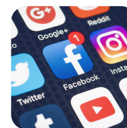
skvelé spojenie pomocou sociálnych sietí