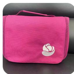
zadarmo taštička s propagačnými materiálmi a drobnosťami na starostlivosť o stómiu

Domov z nemocnice odídete so stomickými pomôckami na 1 mesiac. Nebudete tak musieť hneď prvé dni po prepustení riešiť ich dostupnosť. Počas celého vášho života so stómiou tu budú pre vás špecialistky v zákazníckom centre. Môžete s nimi hovoriť o produktoch, starostlivosti o stómiu, aktivitách bežného života. Ak nebudú vedieť zodpovedať vaše otázky, tak vás nasmerujú na odborníkov vo vašom regióne. V prípade záujmu vám pošlú bezplatne vzorky našich produktov na vyskúšanie. Budete tiež dostávať bezplatný časopis Radim, ktorý je plný užitočných tipov a rád na život so stómiou.