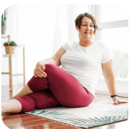
program me+ recovery súbor cvikov pre rýchlejšiu rekonvalescenciu