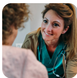
poradenstvo zdravotníckych pracovníkov

Keď potrebujete radu, podporu a istotu, sme tu pre vás. Môžete sa zúčastniť prezenčných prednášok a stretnutí alebo zavolať našim špecialistkám v zákazníckom centre, ktoré sú ochotné vždy poradiť.