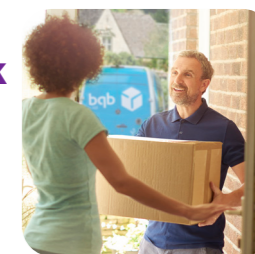
spoľahlivé doručenie pomôcok až k vám domov

Naša diskretná doručovacia služba vám prinesie všetky stomické pomôcky, ktoré potrebujete, priamo k vašim dverám. Vieme, aké sú pre vás dôležité, a preto naše bezplatné, rýchle a spoľahlivé doručenie znamená, že sa nebudete musieť obávať, že ich nebudete mať k dispozícii.